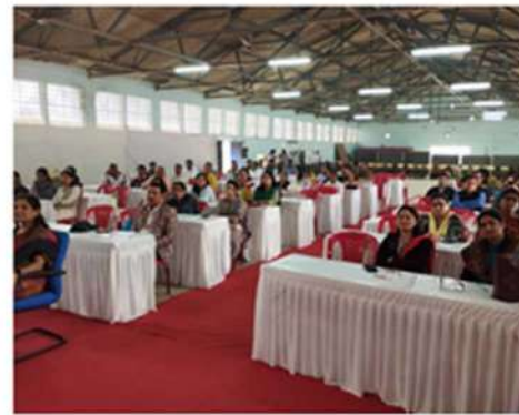
वीवा टीम और सत्र के साथ जागरूक नागरिक कार्यक्रम (एसीपी) में भाग लेने वाले शिक्षकों के साथ समूह तस्वीर

1. केन्द्रीय विद्यालय संगठन, मुंबई क्षेत्र ने केवी-1 एएफएस लोहेगाँव, पुणे में उस क्षेत्र के केवी स्कूलों के लिए एसीपी वर्ष-1 और वर्ष-3 प्रशिक्षण का आयोजन किया। विद्यालय स्थल पर शिक्षकों का पारंपरिक मराठी तरीके से स्वागत किया गया और सभी के लिए अच्छी व्यवस्था की गयी थी।